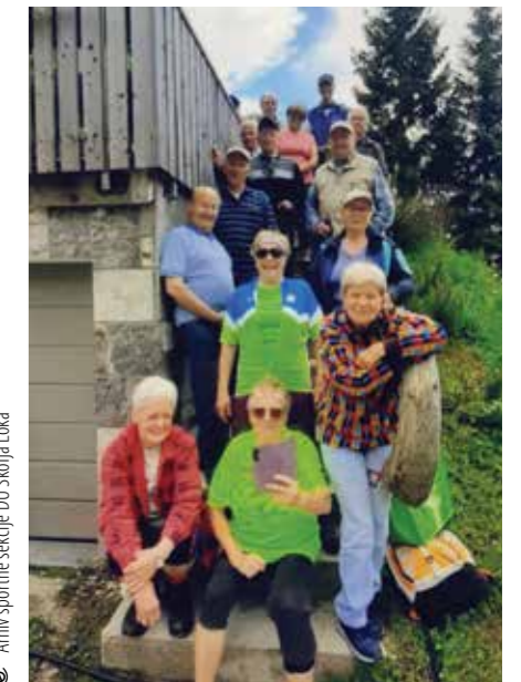
Zbrani pri koči na Blegošu na dan razglasitve rezultatov