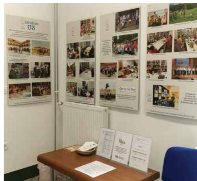
V sekciji Skriti biseri Slovenije spoznavamo Slovenijo in tudi slovenstvo onstran meje, tokrat po Koroški in v Celovcu.