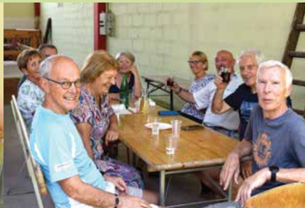
► Veselo razpoloženi člani omizja na poletnem srečanju loških upokojencev.