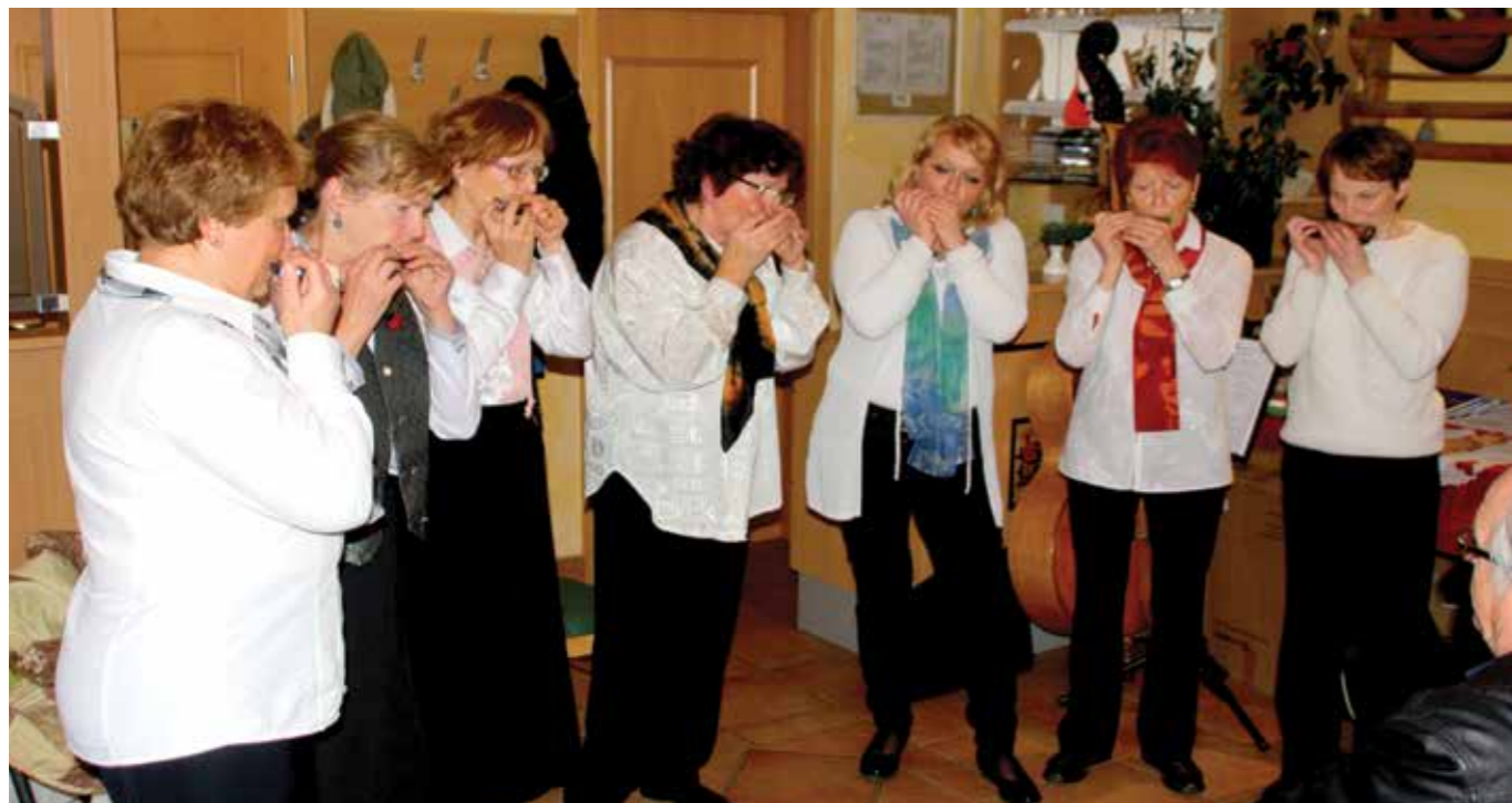
Naši začetki v letu 2016

Tako smo si letos, po zadnjem marčevskem nastopu na občnem zboru članov DU Škofja Loka, vzeli daljši premor. Ker nas ljubezen do igranja orglic in glasbe druži, nastopanje pa neizmerno veseli, saj z glasbo bogatimo tako sebe kot naše poslušalce, smo avgusta v okrnjeni sestavi nadaljevali vaje in priprave na bogato jesen. Že tradicionalno bomo nastopili na prireditvi Veter v laseh, obeta sem nam nastop na italijanskem festivalu Barkarola, nastopali bomo na mednarodnem srečanju orgličarjev v okviru Mihaelovega sejma v Mengšu in september sklenili z nastopom na Festivalu za tretje življenjsko obdobje v Cankarjevem domu v Ljubljani. Veselimo se tudi vseh drugih nastopov, zato se na vabila radi odzovemo.