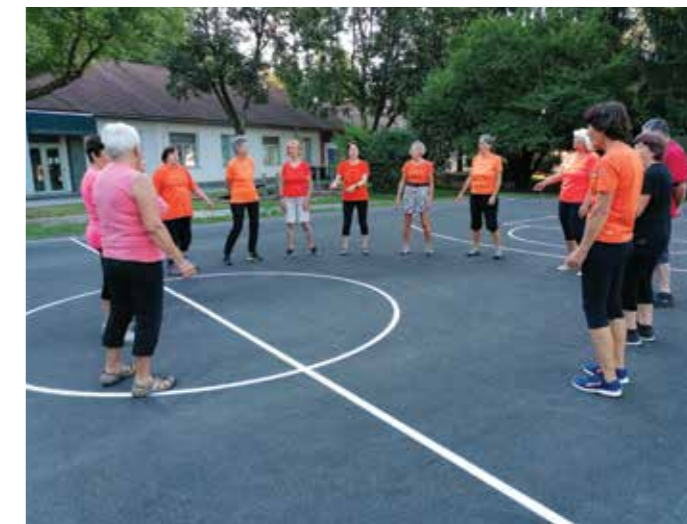
Tisoč gibov vsako jutro ob pol osmih