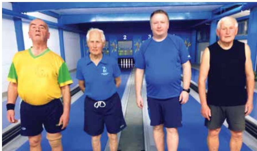
Udeleženci moških dvobojev

Športna zveza Škofja Loka je po koncu sezone 2023/2024 objavila končne rezultate tekmovanja za »NAJKEGLJAČA IN NAJKEGLJAČICO«. V točkovanju tega tekmovanja so upoštevani krompirjev in novoletni turnir, trije krogi medobčinske lige, posamično prvenstvo in prvenstvo dvojic.