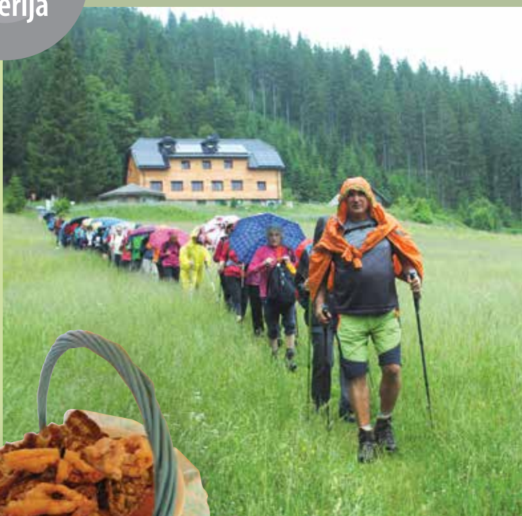
► Planinski pohodniki se ne ustrašijo niti deževnega dne.