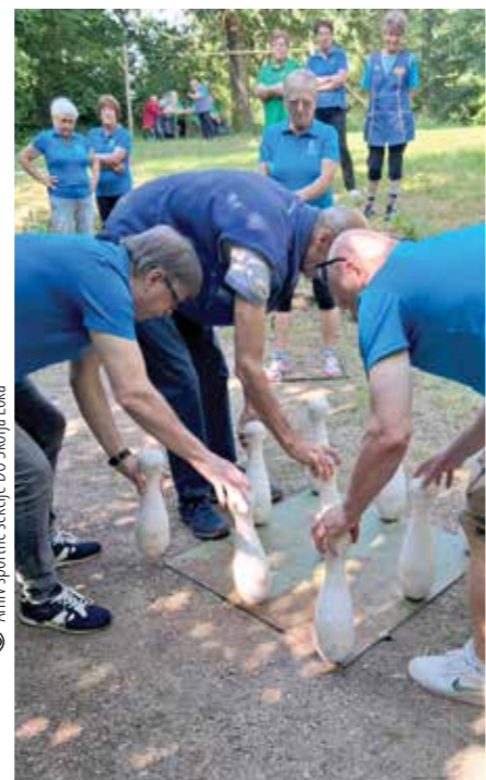
Srečanje s športnimi prijatelji pod lipo

Športno društvo Baron Logatec nas je letos že petič povabilo na Srečanje pod lipo. Pri taborniški koči Rodu srnjaka na Naklem pri Logatcu smo se srečali 6. junija. Na to prijateljsko srečanje, ki je posvečeno državnemu