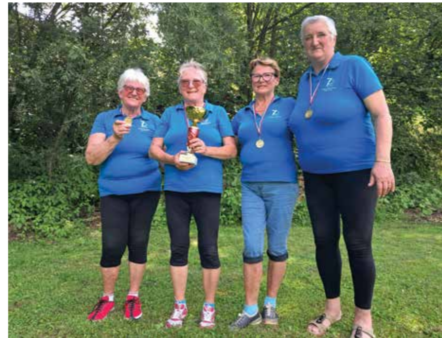
Gorenjske prvakinje v prstometu

Letošnje prvenstvo PZDU Gorenjske v prstometu je bilo 7. junija v prstometnem parku v Britofu pri Kranju. Organizator prvenstva je