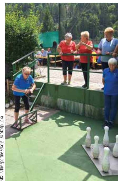
Dobri smo tudi v kegljanju s kroglo na vrvici.

DU Dovje - Mojstrana je letos organiziralo tekmovanje PZDU Gorenjske v kegljanju s kroglo na vrvici. Udeležilo se ga je devet