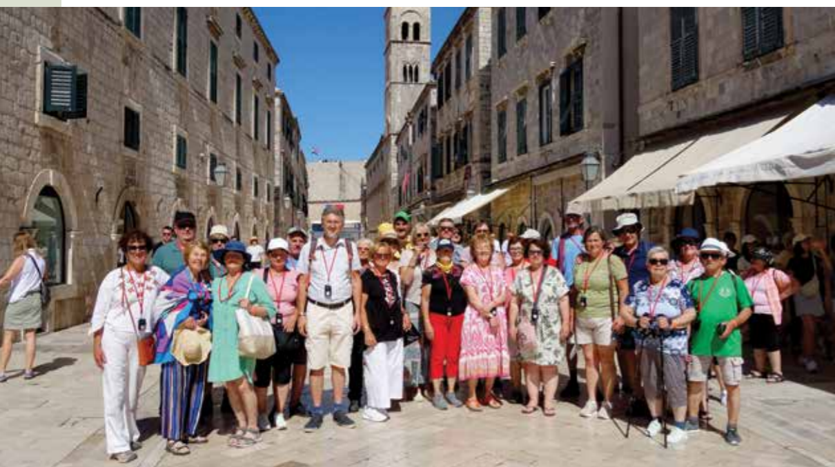
Upokojenci gremo radi na pot.