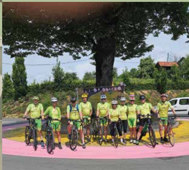
► Člani kolesarske sekcije so ob zmagah Tadeja Pogačarja »romali« v njegovo rodno Komendo.