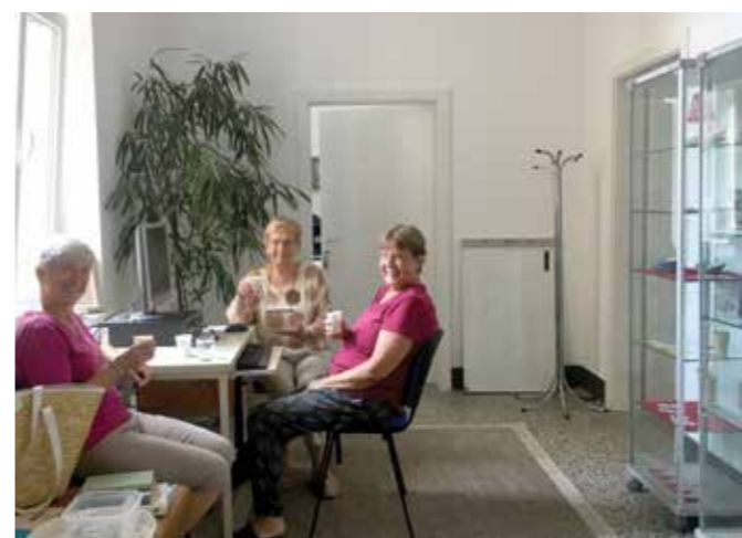
Dnevna soba U3

Taki so bili naši začetki. Po desetih letih se je Društvo Univerza za tretje življenjsko obdobje (U3) podalo na