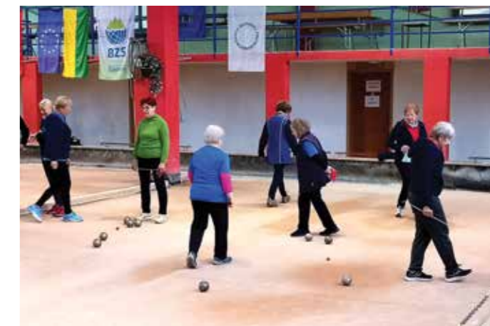
Balinarji med treningom na Trati

V društvu smo zelo veseli, da imamo med našimi vodji športnih sekcij tako prijetne ljudi. Zato ste dobrodošli vsi, ki bi se radi pridružili tej vrsti rekreacije.