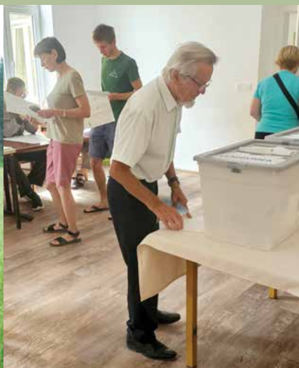
► Evropske volitve 2024 v prostorih DU Škofja Loka