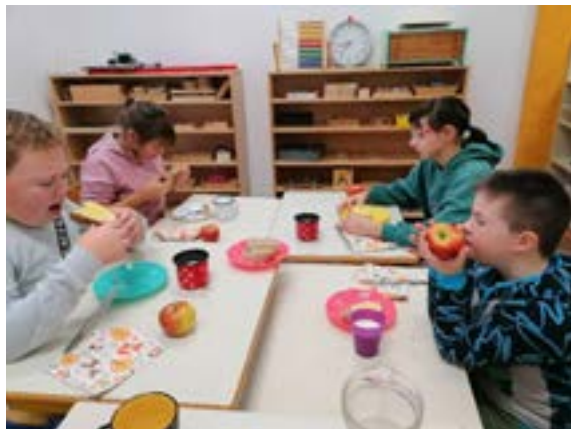
Malica – naš najljubši del dneva

Gostovanje v vojašnici nam je zelo všeč in hvaležni smo za prijaznost in sprejemanje ter za tri učilnice, v katere vsak dan radi prihajamo. Kljub temu pa se seveda veselimo tudi tega, da bo naša šola obnovljena in da bomo v njej lahko vsi razredi OŠ Jela Janežiča.