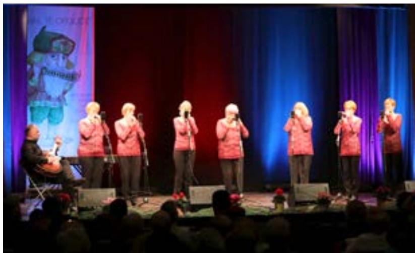
25. Mednarodni festival ustnih harmonik »AH, TE ORGLICE«

Povabili so nas tudi na 25. Mednarodni festival ustnih harmonik »AH, TE ORGLICE« . Letošnjega so pripravili 24. februarja, ko praznujemo SLOVENSKI DAN ORGLIC / USTNIH HARMONIK. Organizatorji so orgličarje hkrati z večernim gala koncertom v Kulturnem domu v Mokronogu širši javnosti predstavili tudi s premiero spletnega koncerta na YouTube kanalu JSKD OI Trebnje. Na njem je zaigralo 19 solistov in skupin iz Slovenije, Nemčije,