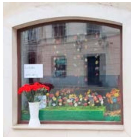
Glinene rože v oknu Loške hiše

Še poseben poklon pa smo dobile, ko je postal naš pisan travnik ozadje za županovo čestitko za 8. marec.