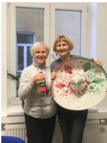
Ela in Sonja sta predstavili Mehiko. (Glej str. 27)