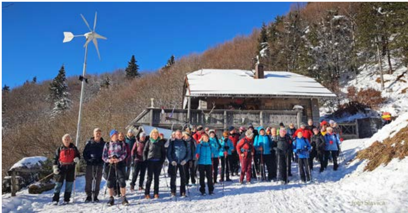
Četrtrkovi pohodniki na Ljubelju

Začela se je nova sezona planinskih pohodov. Spet se nas zbere za poln avtobus, tako da je ob četrtrkovih jutrih pred novo tržnico prav veselo