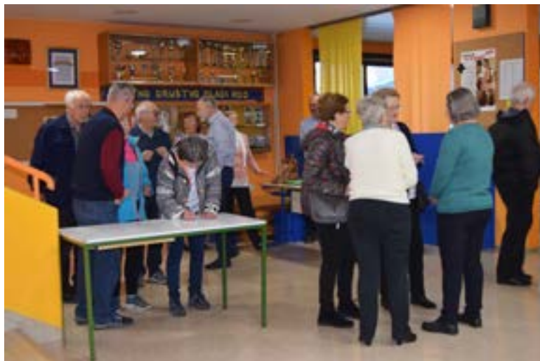
Pred zborom članov smo se vpisali na listo prisotnih.