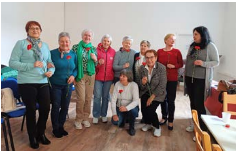
Na zboru članov smo se zahvalili dolgoletnim sodelavkam, prostovoljkam v Društvu U3.

Ciljem smo dodali tudi skrb za najstarejše , ki potrebujejo pomoč. Namenili smo jo predvsem tistim, ki nimajo možnosti uporabe računalnika, sorodniki ali prijatelji pa niso vedno dosegljivi. V pomoč jim je brezplačna tel. št. HALO 65+ 080 2261