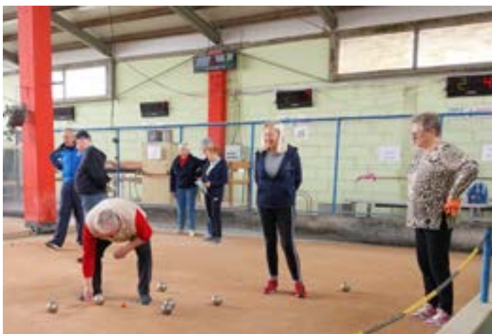
Zimska liga veteranov