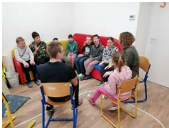
Druženje ob glasbi

V tem šolskem letu smo se Društvu upokojencev, Medobčinskemu društvu invalidov in Društvu U3 v prostorih nekdanje vojašnice pridružili še trije oddelki učencev OŠ Jela Janežiča skupaj z učiteljicami ter varuhinjami in varuhom. Zasedli smo tri lepe obnovljene prostore, ki so v tem letu postali naše učilnice. Trudimo se, da skrbno pazimo nanje in da jih popestrimo z izdelki, ki nastanejo med poukom, da postanejo še bolj živahne. Vsak dan nas je seveda poln hodnik, še posebej ko gremo po malico ali na stranišče, ali ko pripravljamo kaj dobrega v naši mali kuhinji. Hodnik je zanimiv tudi zato, ker je dogajanje tam pogosto pestro in ker na njem lahko pozdravimo gospe in gospode, ki jih srečamo in s katerimi včasih tudi malo poklepetamo. Člani društev, ki imajo svoje prostore v vojašnici, so nas že dobro spoznali, zato verjamemo, da smo jim popestrili marsikatero dopoldne. Učenci in učenke radi spremljamo dogajanje v vojašnici.