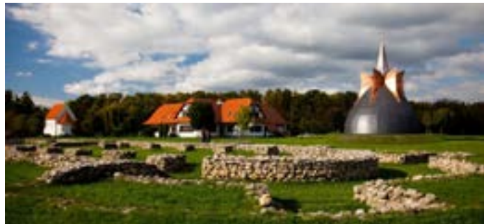
Zalavar - zgodovinski spominski park

Drugi avtobusni izlet bo 15. in 16. maja 2024 v madžarski Zalavar in k Blatnemu jezeru . V Zalakarosu bomo obiskali toplice, ki se ponašajo z največjim bazenskim kompleksom v tem delu Evrope. Podroben program si lahko ogledate na spletni strani društva ali se o njem pozanimajte v društvu