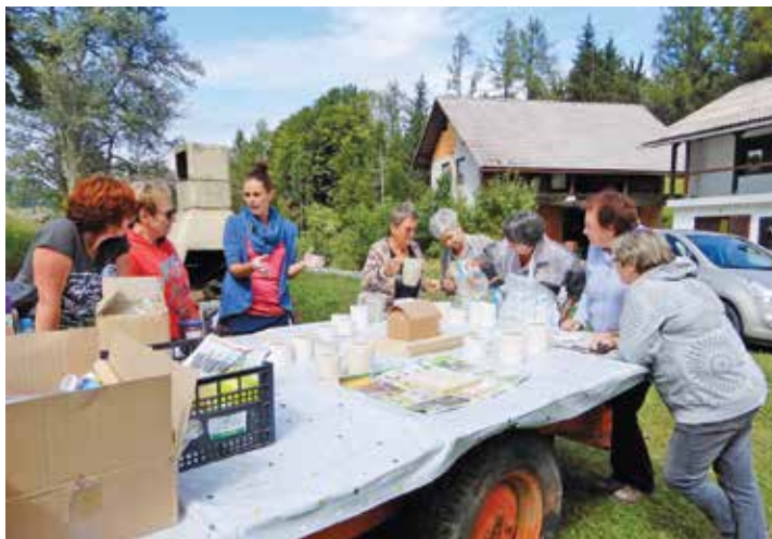
Šola v naravi, ulivanje gline