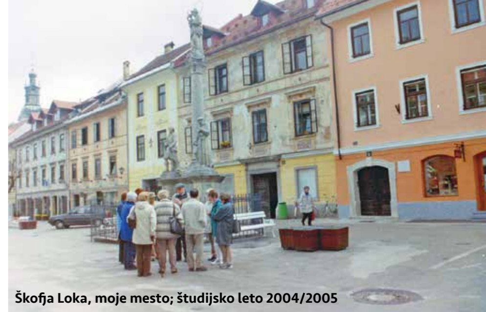
Škofja Loka, moje mesto; študijsko leto 2004/2005

Naši člani veliko potujejo po domači deželi, a potovanja Društva U3 imajo poleg zabavnega druženja namen tudi izobraževati. V program vključujemo zanimive destinacije. Vsaka šola ob zaključku šolskega leta organizira zaključni izlet – in tako ga tudi naša univerza, le da to ni le izlet, ampak strokovna ekskurzija. Med študijskimi krožki na programu ni geografije Slovenije, zato smo že na dan prve ekskurzije leta 2005 dali poudarek geografski predstavitvi pokrajine na poti do Ilirske Bistrice, gozdovom pod Snežnikom, kulturni dediščini in ljudem. Prva postaja je bila na Premu,