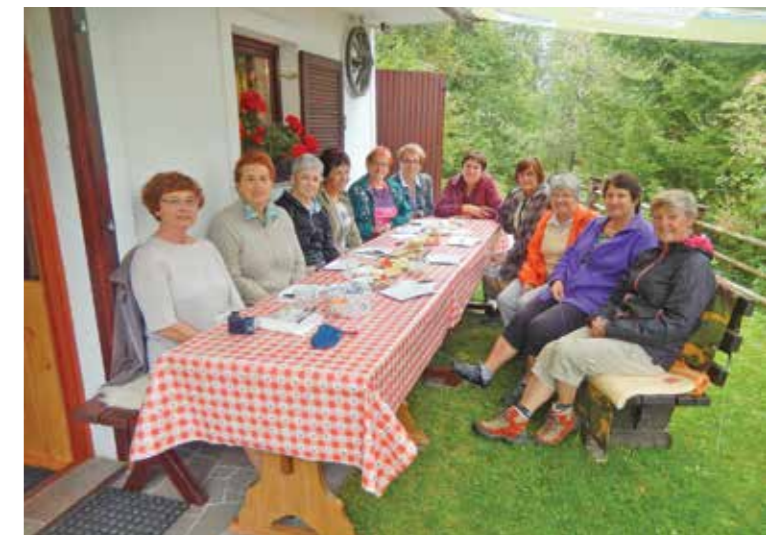
Srečanje članic uredniškega odbora

so del zgodovine Tavčarjevega dvorca na Visokem in se sprehodili po starodavni Škofji Loki. Obudili so staro glasbo in okuse srednjeveških jedi.