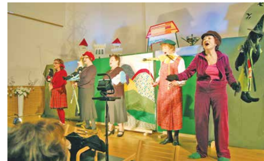
Dramska skupina ŽAR z UTŽO Ajdovščina

vsem univerzam za tretje življenjsko obdobje po Sloveniji, se festival vsaki dve leti seli v drugo regijo. Po prvem festivalu v Škofji Loki so se v nadaljnjih letih odvijali festivali v Novi Gorici (leta 2013), Velenju (leta 2015), Šmarju pri Jelšah (leta 2017) in Domžalah (leta 2019). Festival je zlagoma prerasel v prepoznaven dogodek mreže, ki povezuje med seboj slovenske univerze za tretje življenjsko obdobje kot tudi sorodne organizacije iz Slovenije in tujine.