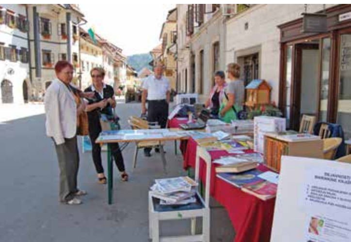
Promocija Društva U3 na Mestnem trgu Delavnica uporabe pametnega telefona