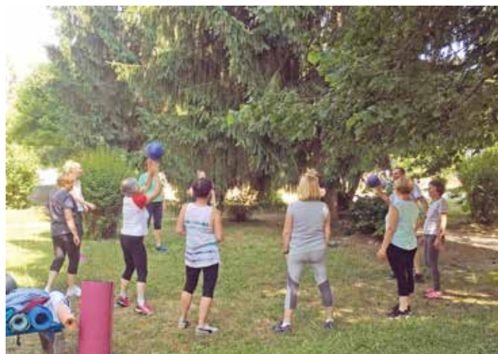
Poletna univerza – pilates