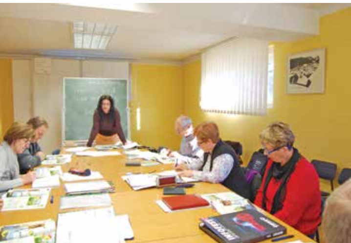
Študijski krožek angleščine

Društvo Univerza za tretje življenjsko obdobje Škofja Loka - Društvo U3