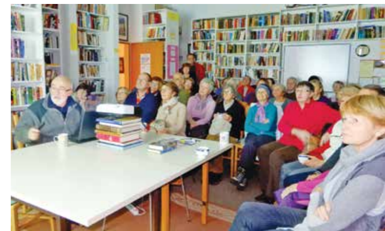
Caj ob petih

Za našo univerzo je 15 uspešnih let delovanja in tudi finančnega poslovanja, ko je univerza uspešno rasla in postala prepoznavna ne le v lokalnem, temveč tudi v širšem okolju. Za naslednjih pet let smo si zastavili ambiciozen načrt rasti: vsako leto povečati vpis vsaj za deset odstotkov. Študijske krožke bomo financirali s prispevki slušateljev in tudi iz sredstev proračuna občine in države. V letu 2019 smo od Ministrstva za izobraževanje, znanost in šport pridobili dva tisoč evrov. Za realizacijo programov izobraževanj smo iz občinskega proračuna prejeli 5.991,49 evra. Obenem nam je občina odobrila 315,85 evra za projekt letošnje praznične prireditve. Enako bomo prejeli tudi v naslednjem letu. Vsekakor to pomeni, da bomo za uspešno realizacijo študijskih programov potrebovali dodatna finančna sredstva. Glede na to, da slušateljem želimo ponuditi kakovostno in cenovno ugodno ponudbo izobraževanj in delavnic, se bo naša univerza tudi v prihodnje prijavljala na projekte, ki bodo financirani na lokalni in državni ravni.