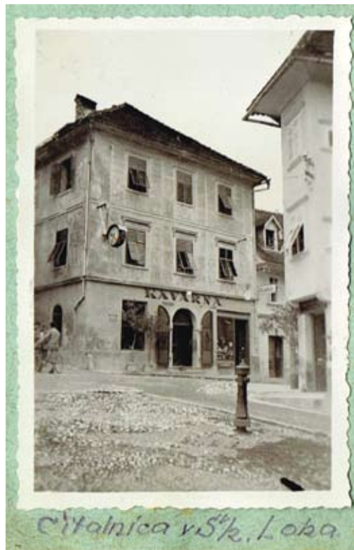
V tej stavbi je danes Pekarna Orehek.