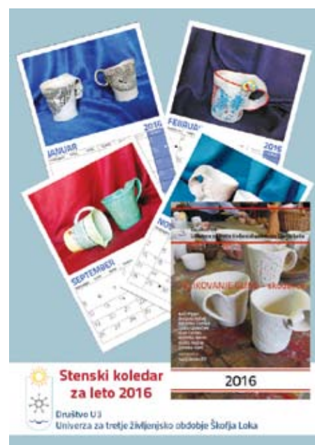
Udeleženke krožka oblikovanja gline svoje skodelice predstavljajo v koledarju za leto 2016.

Če vas katera od ponujenih dejavnosti zanima, pridite na klepet ob ponedeljkih od 14.30 do 16.30 in četrtek od 10. do 12. ure.