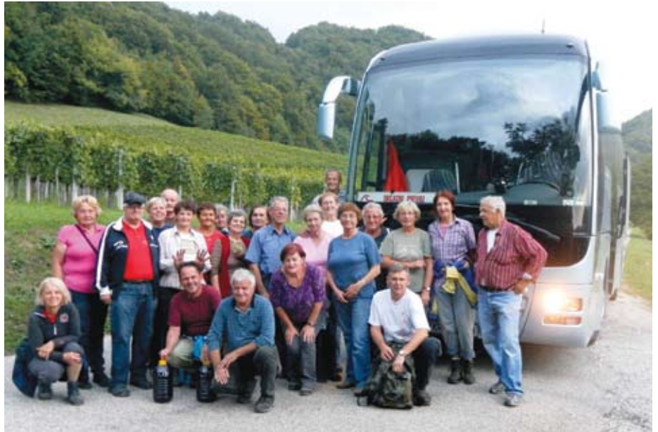
Trgači na Bizeljskem

Bili smo resnično pridni in čeprav je sonce kar močno pripekalo, je bilo razpoloženje prav prijetno. Ob 13. uri so nam gostitelji pripeljali malico. Posedli smo, kjer je bil prostor, ter zagrizli v okusno domače svinjsko meso, kuhane domače klobase in ostale dobrote. Naš apetit je še dodatno spodbudil vonj po kruhu iz krušne peči. Vse skupaj smo zalili z rujnim vincem in se po obilni malici spet lotili dela. Vinogradi so bili na različnih lokacijah in tako smo za dobro prebavo tudi prehodili nekaj kilometrov.