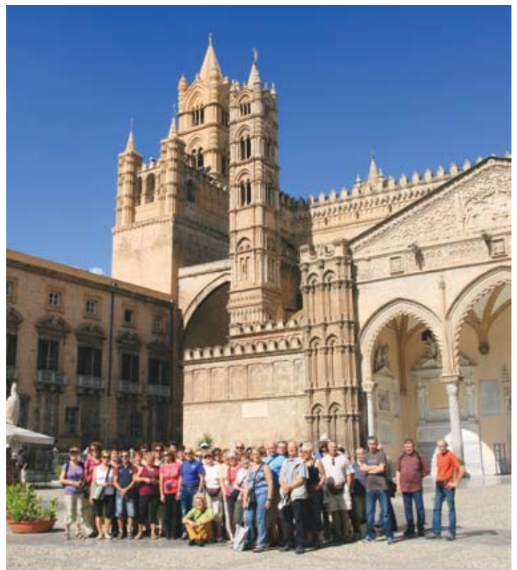
Loški upokojenci pred stolnico v Palermu