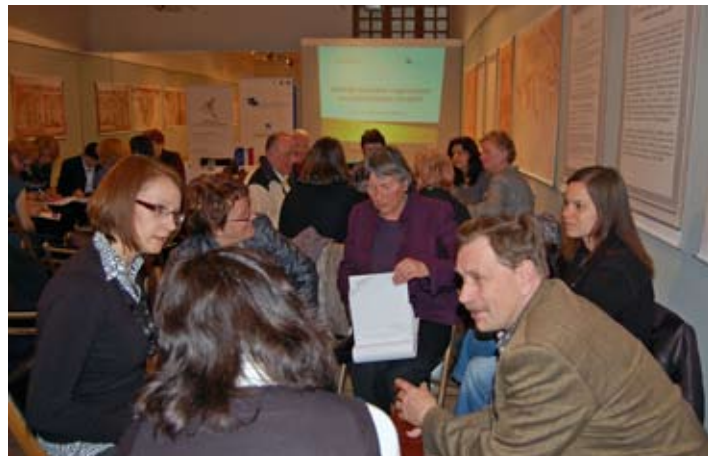
Živahne razprave v delovnih skupinah

www.seniorji.info/IZOBRAZEVANJE_Vodenje_izobrazevanja_starejsih_v_nevladni_organizacij