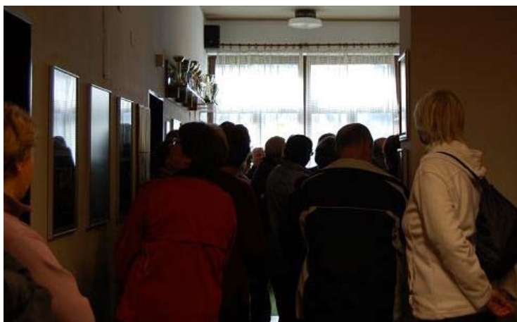
Odlično obiskana otvoritev razstave