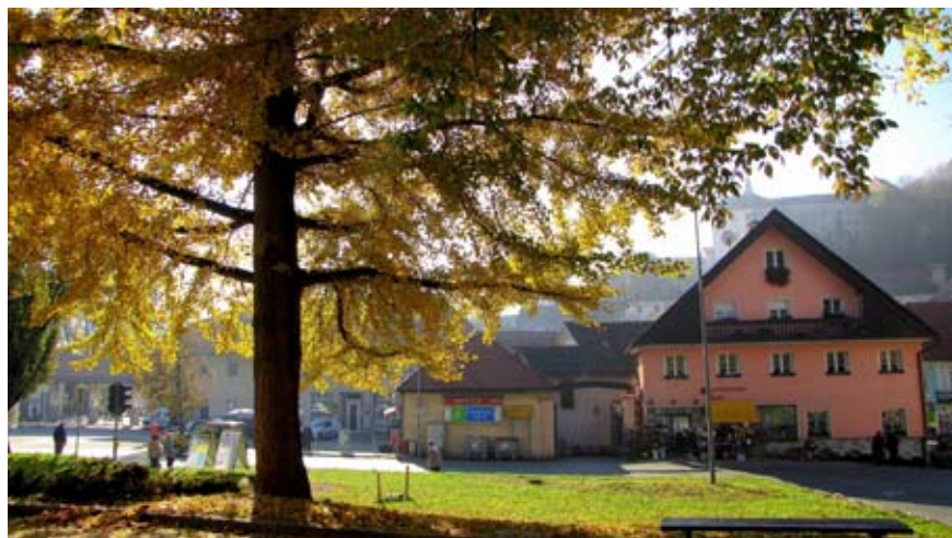
Ginko pred Namom