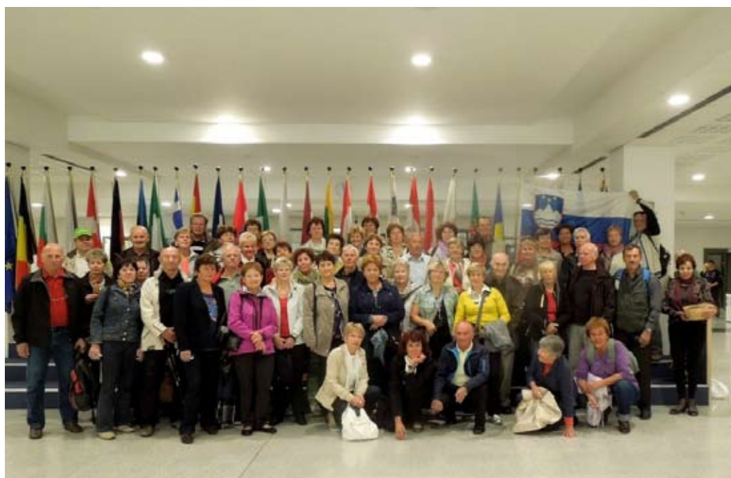
Člani DU Škofja Loka v Evropskem parlamentu

Za zaključek si je ogledala še naše prostore in bila priča delavnici izdelovanja cvetličnih aranžmajev, ki so jih pod vodstvom Sonje Dolinar