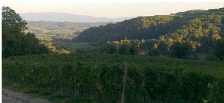
RAZGLLED NA BIZELJSKO