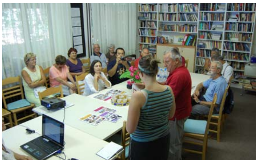
Udeleženci delavnice v našem društvu

Najprej smo se srečali pred Centrom DUO na Mestnem trgu, kjer smo se spoznavali z udeleženci delavnice in s kulinaričnimi posebnostmi iz njihovih držav. V sredo smo goste sprejeli v prostorih društva in jim predstavili delovanje DU in univerze ter navezali stike za nadaljnje sodelovanje. V četrtek smo jih popeljali po našem starem, znamenitem mestu, zgodovino pa so spoznali tudi v muzeju. V petek zvečer, preden so se poslovili pa so nas povabili na večerjo v Kaščo. Srečanje z udeleženci delavnice smo izkoristili za iskanje možnih partnerjev za izmenjavo prostovoljcev in za druge oblike sodelovanja.