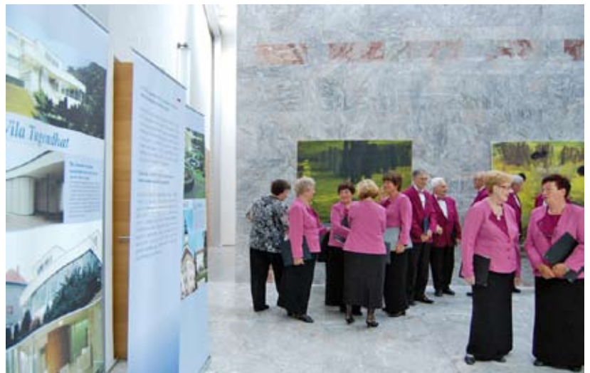
MePZ Vrelec čaka na nastop