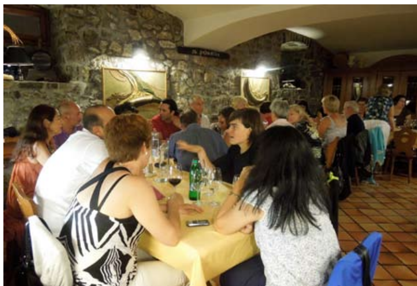
Druženje ob večerji v Kašči