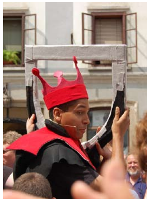
Historial: Jose kot zamorc s krono v občinskem grbu

Naslednji dan smo se navsezgodaj zbrali v Sokolskem domu. Predstavili smo področja aktivnosti našega društva, pozdravili so nas predstavniki Freisinga in že smo pohiteli na Mestni trg na ogled spreveda Historial. Škoda, da je šepalo obveščanje in da se Ločani niso bolj množično udeležili dogajanj v Kristalni dvorani.