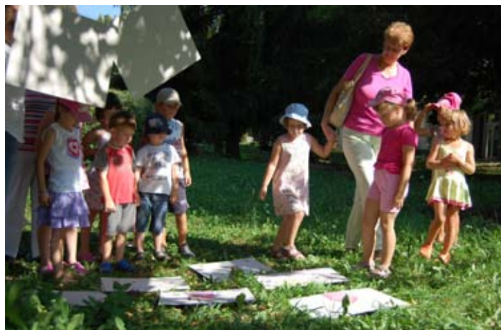
Ogled slikarske razstave pod lipo