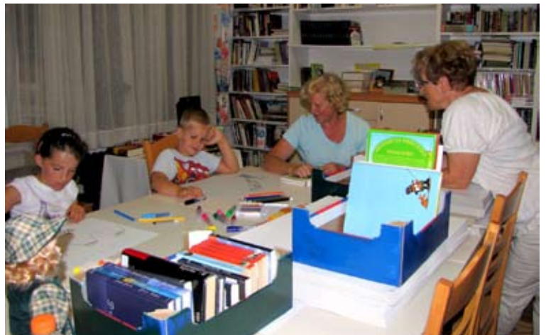
Na petek, 15. julija, je deževalo. Dobili smo se v Marinkini knjižnici!