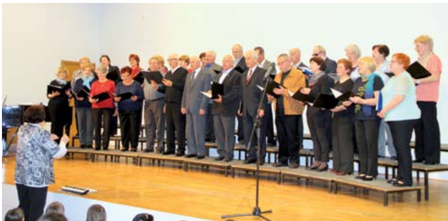
MePZ Vrelec na koncertu Generacije pojejo

Po utečenem zaporedju je bilo tudi 15. maja 2016 v Kulturnem domu srečanje upokojenskih PZ. Gorenjski upokojenci pojejo v Kulturnem hramu Ignaca Borštnika v Cerkljah, kjer je bilo prijavljenih za nastop 18 zborov gorenjskega in kamniškega