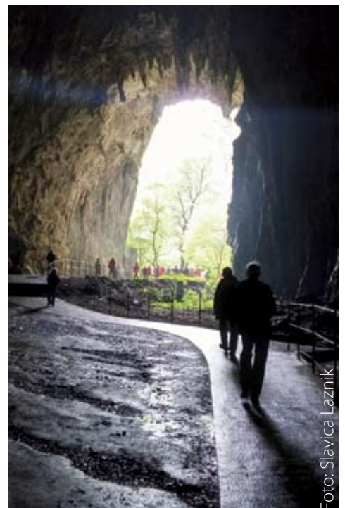
Izhod iz jame

Pohvaliti moram vse naše pohodnike za popolno udeležbo. Kljub slabši napovedi vremena so prišli vsi prijavljeni. Hvala vam za zaupanje. Vedno se bomo skušali potruditi po svojih najboljših močeh.