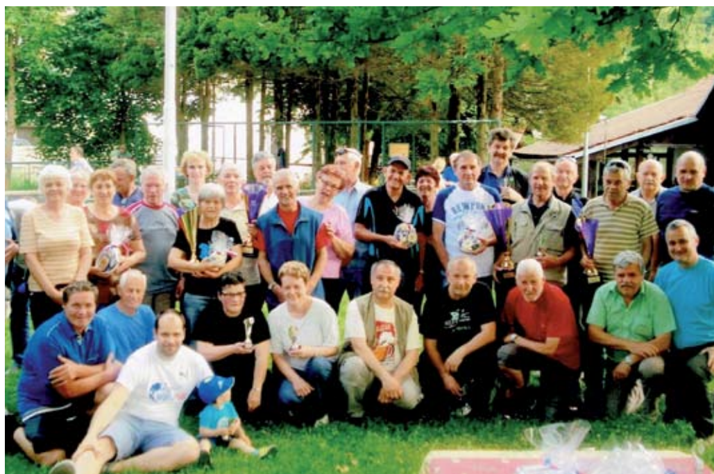
Že s slike se vidi, da imajo naši kegljači in kegljačice največ odličij.

Letos smo zaključek sezone pripravili prej kot običajno in sicer 1. junija 2016.