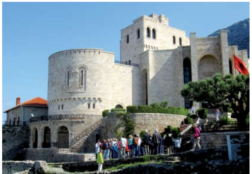
Pogled na muzej albanske zgodovine posvečen narodnemu junaku Skenderbegu

Zadnji dan potovanja smo se odpeljali v Skadar in si tam ogledali starodavno trdnjavo. Za konec smo prihranili še ogled prestolnice Tirane, ki nas je res presenetila po svoji urejenosti, novi, moderni