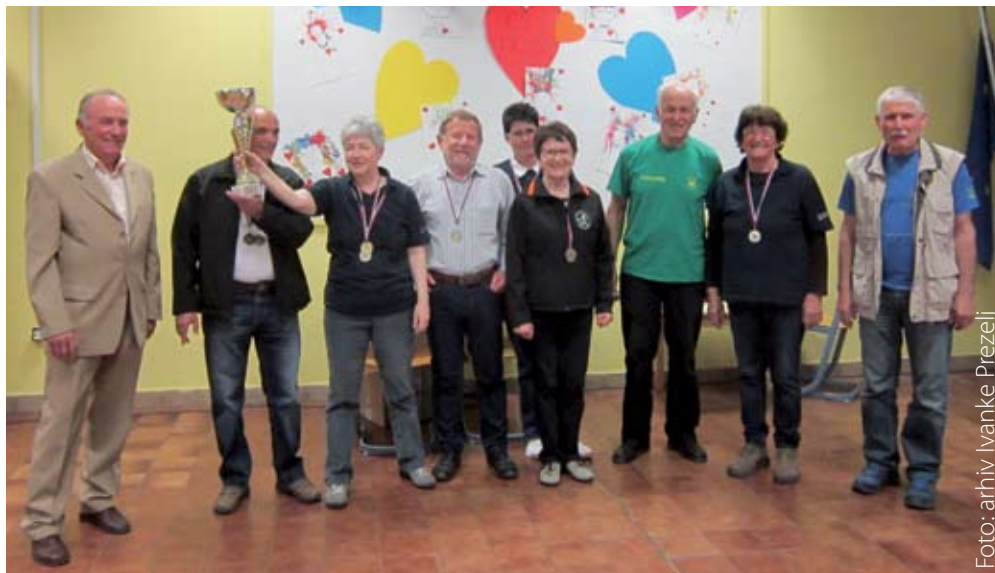
Podelitev prehodnega pokala za najboljšo skupno uvrstitev v moški in ženski konkurenci

Sovinc pa sta zasedli 9. in 16. mesto. Za moškimi DU Škofja Loka so se uvrstili člani društev Kamnika in Jesenic. Organizatorji DU Žerjavčki iz Trzina so bili četrti, za njimi pa so se