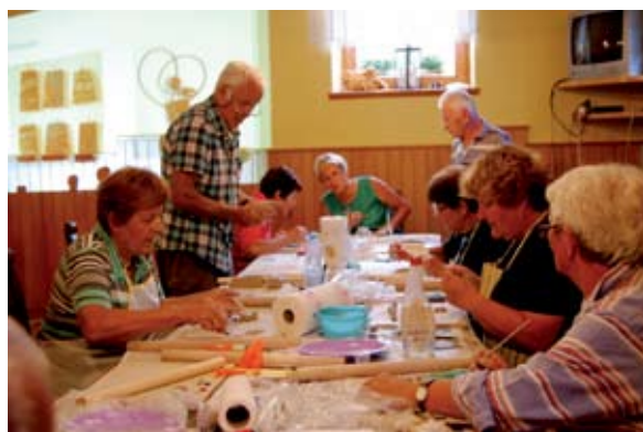
Oblikovanje z glino je stalnica naših šol v naravi.

Od 22. do 25. avgusta se je v Osilnici res dogajalo, saj smo imeli šolo v naravi. Že drugo leto smo preizkusili naše ročne spretnosti in umetniški talent pri oblikovanju gline. Hotel Kovač nam je poleg