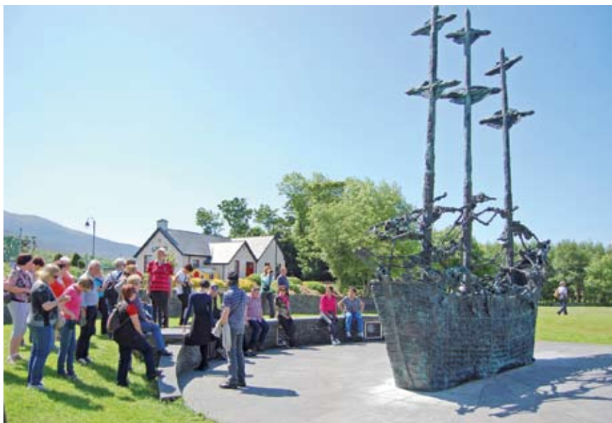
Ladja krsta - pomnik veliki krompirjevi lakoti

V Kilkennyju smo v pivovarni Smithwick` s ustanovljeni leta 1710, izvedeli, kako se vari pivo in zakaj je njihovo pivo rdeče barve. Irška je znana po viskiju, pivu in pubih. Irski pub je gostinski lokal z licenco za strežbo alkoholnih pijač. V njem vlada edinstvena kultura priložnostnega druženja, krepke hrane in pijače, irskih športov in tradicionalne irske glasbe. Obiskali smo več pubov in poskusili več znamk piva. Zadnji večer smo zaključili v Dublinu ob pivu, glasbi in plesu. V pubu v centru mesta sta